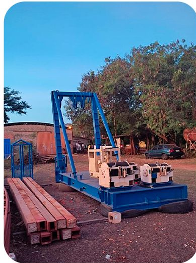
Pórtico e Sinete.

A Valle Rio Negro é certificada e homologada para operações e mergulho dependente até 50 metros.